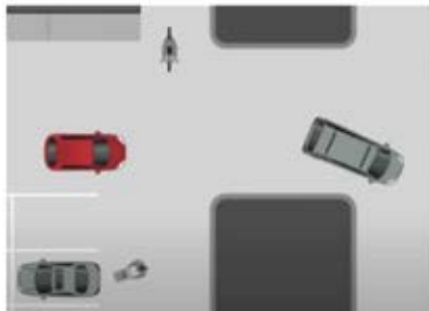
Carreteras en zonas comerciales