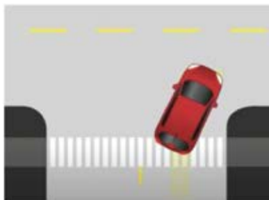
Carreteras en zonas residenciales