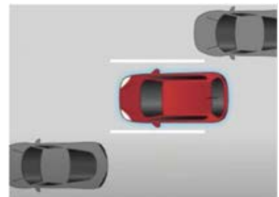
Carreteras en zonas intermedias